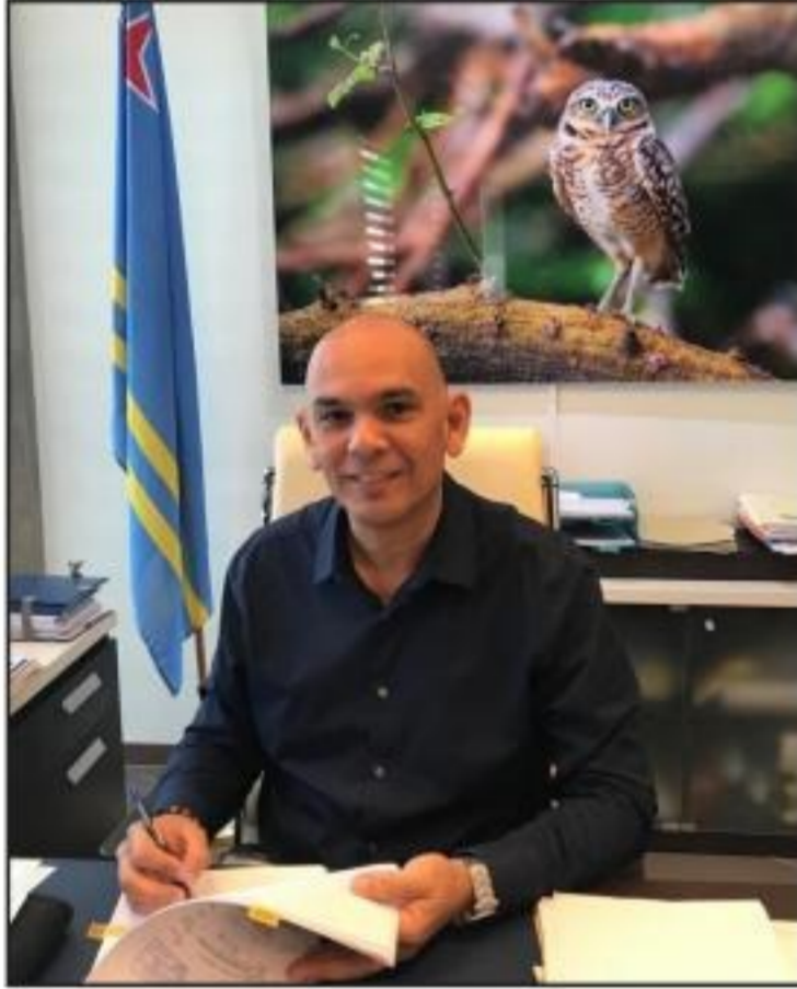
Durante rueda di prensa di Gobierno di Aruba, Minister Otmar Oduber encarga cu Desaroyo

Teritorial, Infraestructura y Medio Ambiente a anuncia cu entrante prome di januari 2019, Parke Marino Aruba oficialmente ta keda introduci. Durante di e ultimo lunanan a hiba combersacion cu diferente instancia y grupo di piscado den diferente bario, a base di e combersacionnan aki a añadi un di 4 area protegi desde prome di januari den e parke marino. E di 4 area ta esun for di Lagoen/cas di gobernador te na Punta Brabo, cu excepcion di e areanan cu tin actividad di crucero tumando luga. Minister a splica cu a tuma e decision aki a base di e casi 90% di peticionnan cu a drenta di piscadonan cu ta sinti cu den